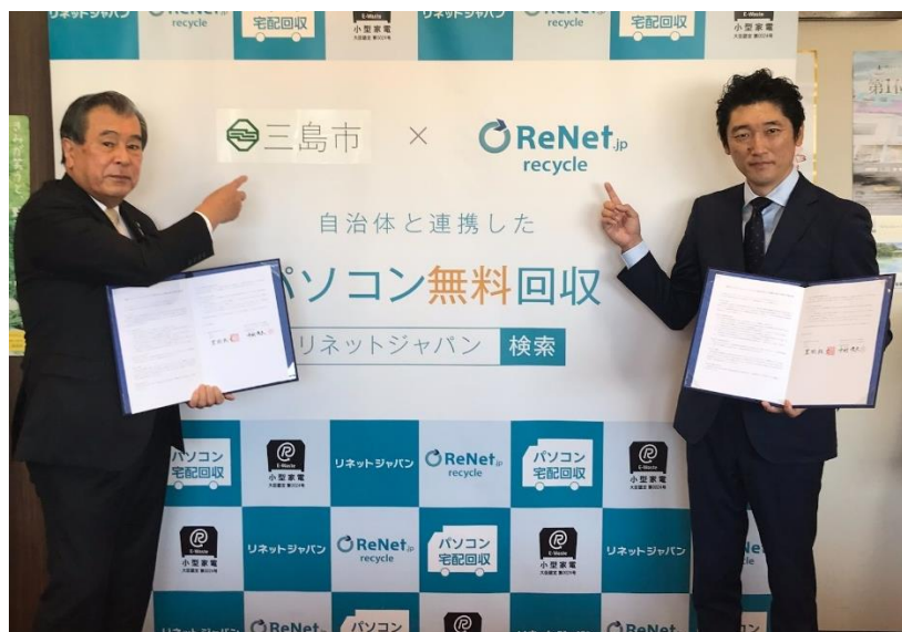
10/14 三島市との協定式

10月14日に三島市の豊岡市長と協定式を実施しました。三島市との協定締結は全国で480例目、静岡県内では11例目となります。