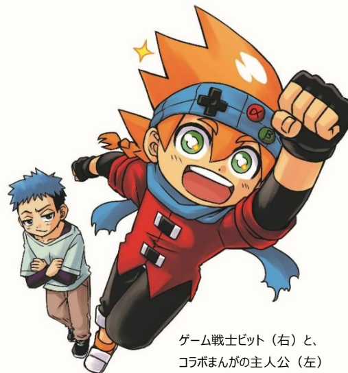
ゲーム戦士ビット（右）と、 コロボまんがの主人公（左）

本日10月15日（金）に発売される子ども達のバイブル「月刊コロコロコミック」11月号（発行：株式会社小学館）より、コロコロコミックと株式会社イオンファンタジー（本社：千葉県千葉市、代表取締役社長：藤原徳也）が運営するオンラインスクール「ゲームカレッジ Lv99（レベルキュウキュウ）」とのコラボまんが『ゲーム戦士ビット！特別編 極めろ！ゲームカレッジ Lv99』（作：瀬戸カズヨシ）の連載がスタートします。