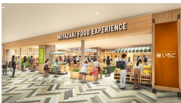
「みやざきフードエクスペリエンス(仮称)」イメージ

いちごおよびソラシドエアは、これらの取り組みを通じ、宮崎県や神奈川県等の農水産業等の持続可能性を高め、地域の活性化に貢献してまいります。