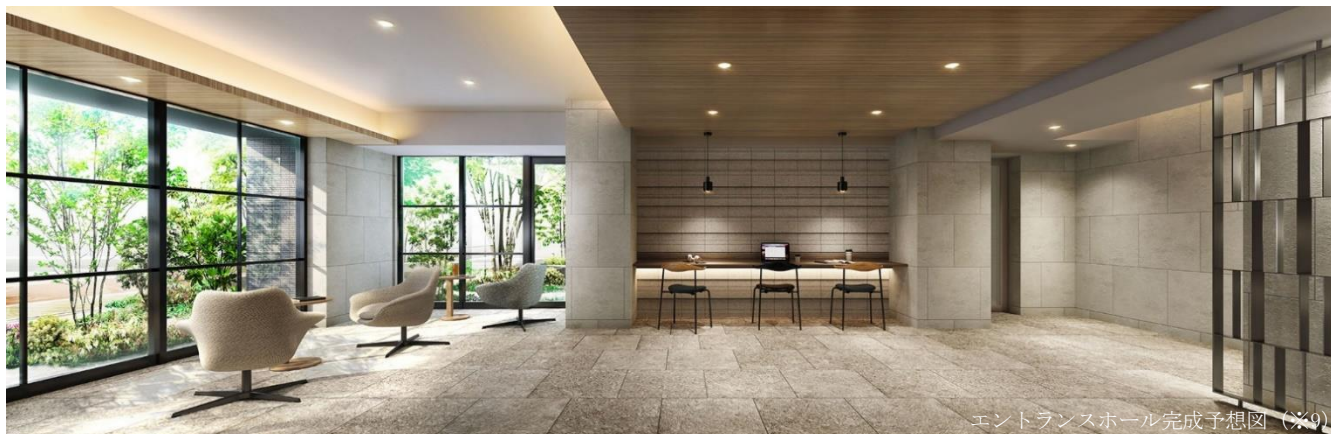
エントランスホール完成予想図(※9)