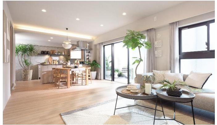
リビング・ダイニング・キッチン C3タイプ (※16)