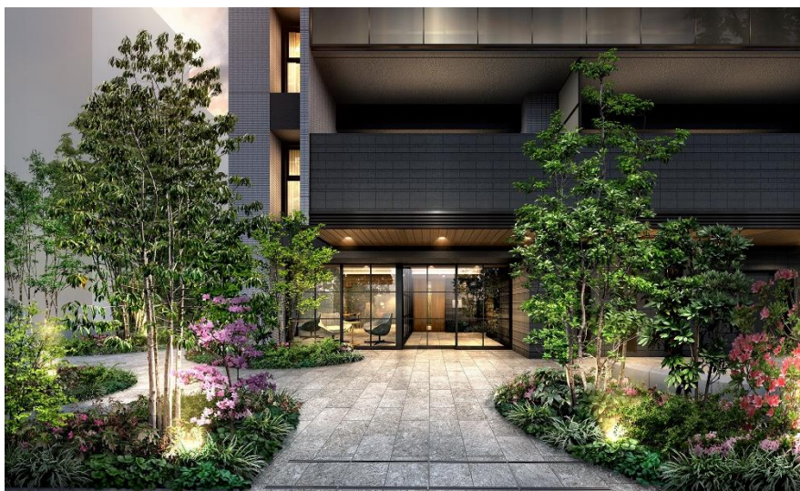
エントランスアプローチ完成予想図(※9)