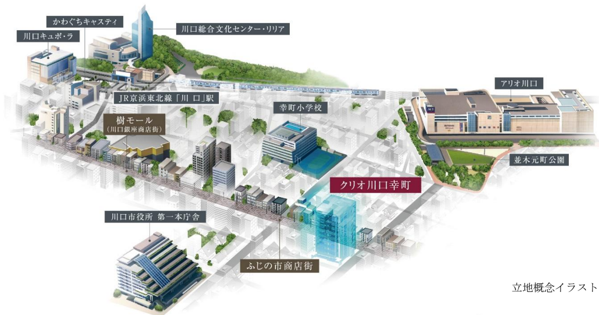
立地概念イラスト（※2）

「クリオ川口幸町」は駅から徒歩10分の「ふじの市商店街」に隣接している立地に誕生します。川口市役所をはじめとする公共施設や通学区の幸町小学校にも近接しており、利便性の高い充実した住環境が魅力の物件となります。角住戸率100%・全戸ワイドスパン（※1）を採用した二面接道のランドプランに、開放感のある2LDK～3LDK、54.75㎡～71.46㎡の住戸をご提案しています。