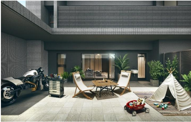
テラス・オープンガレージ完成予想図 C2タイプ (※9)