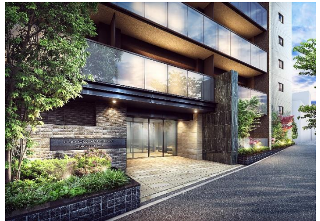
エントランスアプローチ完成予想図（※4）