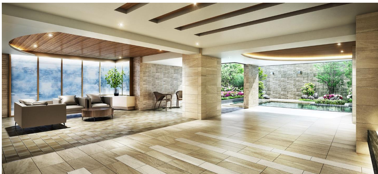
エントランスホール完成予想図 (※17)