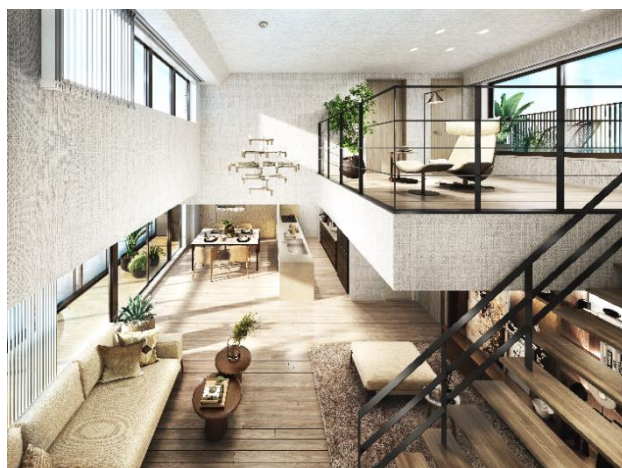
リビングダイニングキッチン・ホール完成予想図（Mタイプ）（※10）