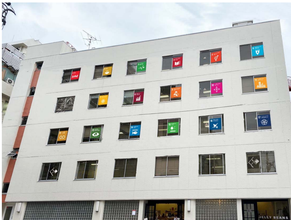
〈写真2〉 KUROMON サステナ・スクエア