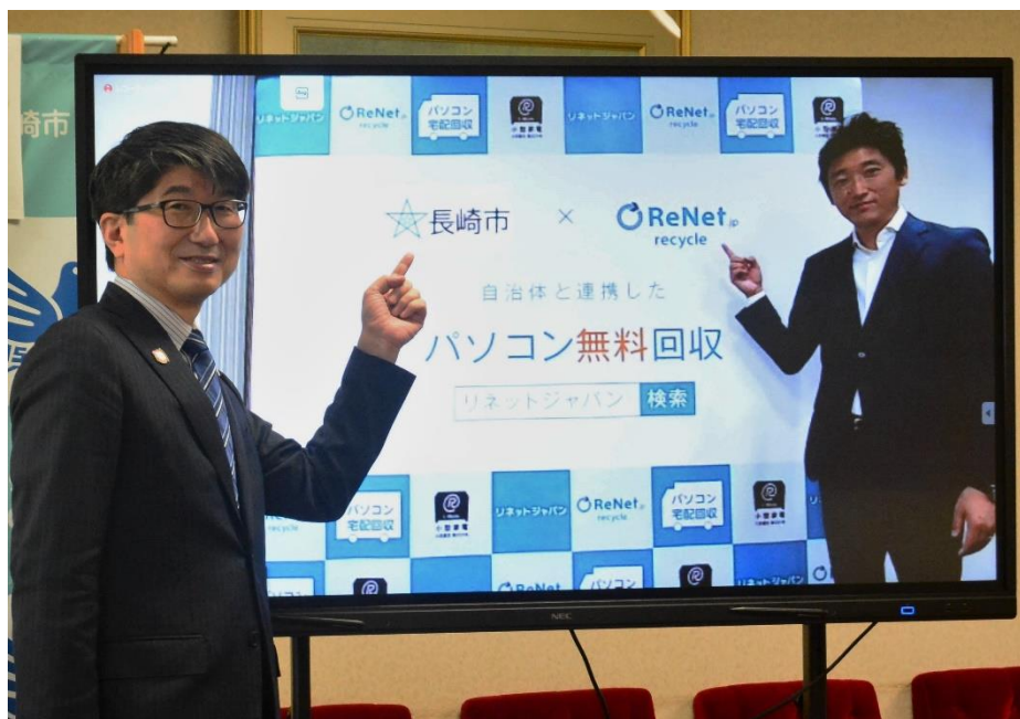
10/21 長崎市との協定式

10月21日に長崎市の田上市長とテレビ会議によるオンライン方式の協定式を実施しました。長崎市との協定締結は全国で481例目、 長崎県内では初めて となります。