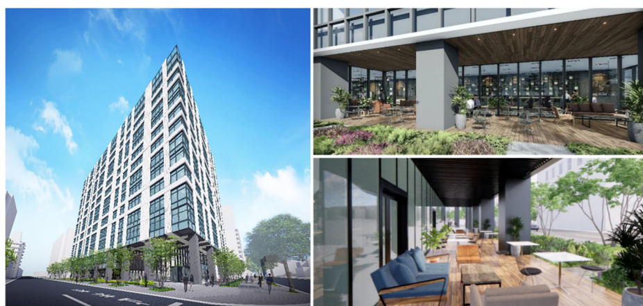
<新大阪第2NKビルイメージ>

株式会社アルファクス・フード・システム（本社：山口県山陽小野田市、代表取締役社長 田村 隆盛、以下 AFS社という）のさまざまな環境表面において感染力を維持し続ける菌やウイルスを簡単にあらゆるシーンで除菌できるゲート型除菌噴霧器「ウイルスゲート・ショット」は、オフィスビル・商業施設などの設置にも適しています。企業や店舗の多くの人々が通勤・ご来場される施設には、安心して安全な環境を提供することが求められ、その対策を実施されることで集客や売り上げアップにも影響すると考えられます。