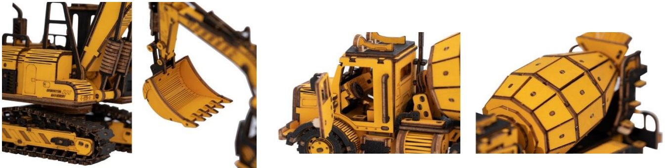
こだわりのパーツ

子どもたちの心を魅了し、大人たちの永遠の憧れである、はたらく車。車好きの方もそうでない方も、だれもが「つくる楽しさ」を味わえるパズルになっています。他の「つくるんです®」シリーズ同様、工具や接着剤は不要。追加の道具を買うことなく、パズルを買ったらすぐ遊べるので、気軽にチャレンジしてみてください。