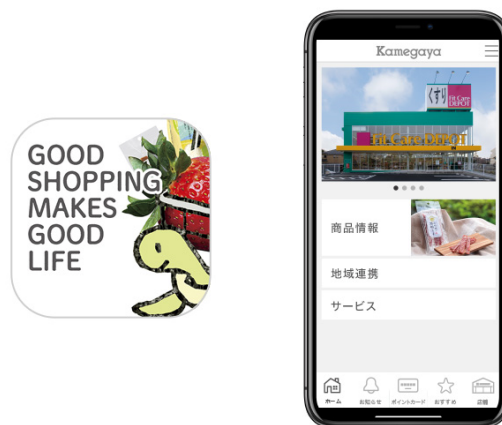
図1 『カメガヤ公式アプリ』 アイコンとトップ画面

その他にも、おすすめ商品等を案内するプッシュ通知やキーワード/カテゴリ/GPSによる店舗検索など、会員様にとって嬉しい機能を取り揃えています。