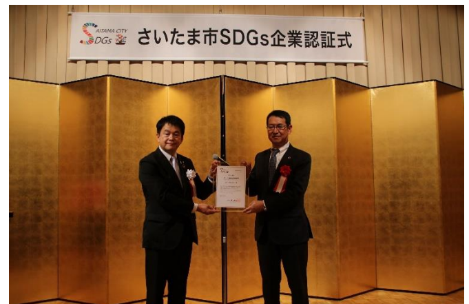
清水市長、当社副社長