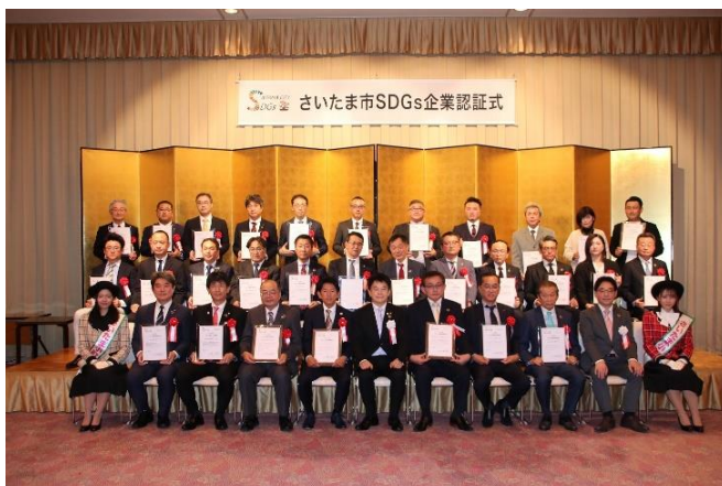
さいたま市 SDGs 認証式（11月9日）

【さいたま市ホームページ】 https://www.city.saitama.jp/005/002/010/013/p080038.html