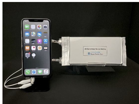
開発した電池とその作動