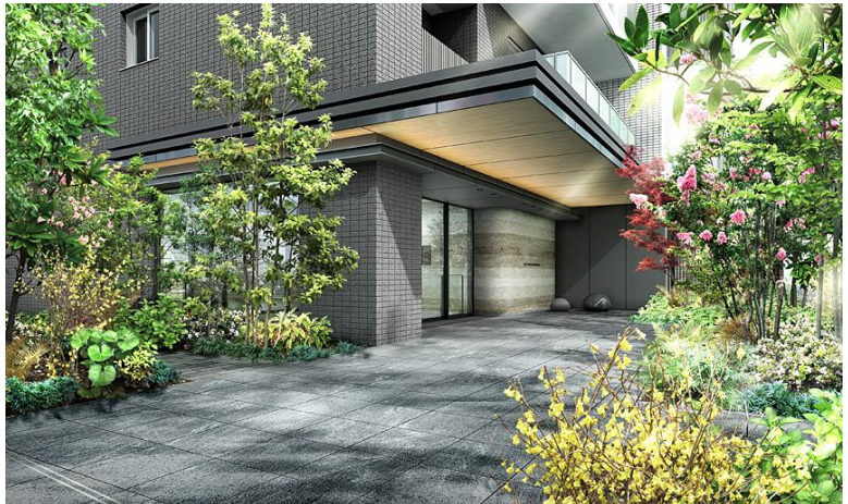
エントランスアプローチ完成予想図（※2）