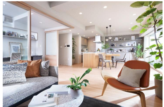
リビング・ダイニング・キッチン (※13)