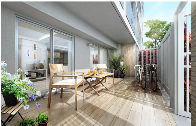
テラス完成予想図 B2 タイプ (※2)