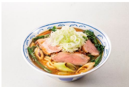
鴨ねぎ麴味噌たんめん(税込 990 円)

スープには、米麴を加えた特製の合わせ味噌を使用しています。香ばしく焼いた旬の長葱や自家製の合鴨チャーシューが、もちもち食感の自家製麴と絶妙に調和した、味わい深い“冬のごちそうたんめん”です。