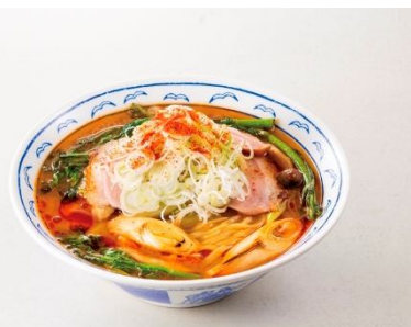
鴨ねぎ麴辛味噌たんめん(税込 990 円)