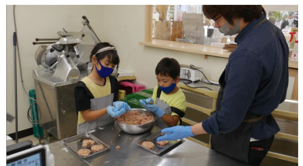
湘南メンチ作り体験

ガイアックスでは、「人と人をつなぎ、夢中で満たす。」というコンセプトのもと aini(CtoC の体験プラットフォーム)を運営しており、aini 内では全国で様々な体験が開催されています。今後、より多くの人々に体験を身近に感じてもらうため、様々な法人との連携を推し進めています。各法人との連携、地域に深く関わる取り組みにより、体験数の増加を目指し、人と人の交流の活性化、地域経済活性化に貢献してまいります。