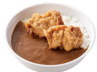
カリガリから揚げカレー