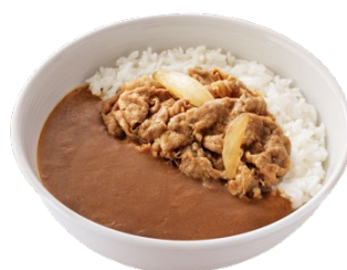
カリガリ牛カレー