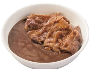
カリガリ牛カルビカレー