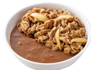
カリガリ肉だく牛カレー