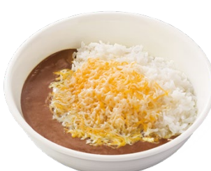
カリガリチーズカレー