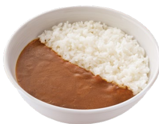
カリガリ吉野家カレー