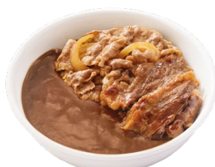
カリガリ牛×牛カルビカレー