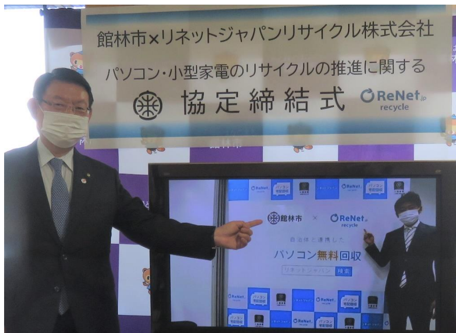
12/2 館林市との協定式

12月2日に館林市の多田市長とテレビ会議によるオンライン方式の協定式を実施しました。館林市との協定締結は全国で497例目、群馬県内では22例目となります。