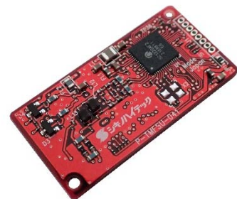
写真：SC1320A 搭載 P-TMFSU-041

ソシオネクストは、パナソニック株式会社がライセンス提供する IEEE1901-2020 準拠の半導体設計用 IP コア「HD-PLC」を採用した世界最初の LSI となる SC1320A を開発しました。ソシオネクストが強みを持つ信号処理技術と回路設計技術により、HD-PLC の特長を活かしながら低消費電力(200mW)、3.3V 単一電源と小型パッケージ (7mmx7mm) による省スペース化などを実現しました。SC1320A は現在サンプルの提供中で、量産の開始は 2022 年第 3 四半期を予定しています。