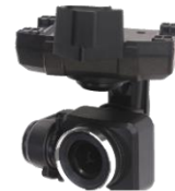
マルチスペクトルカメラ