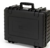
収納ケース (ハード)