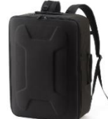
収納ケース (ソフト)