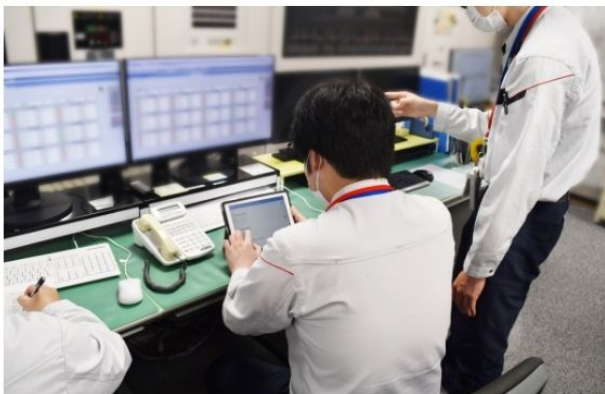
▲現場より情報配信

JR 東日本ビルテックは、試行結果を踏まえ、今後駅ビル事業への展開を進めるとともに、西菱電機と連携してより現場が使いやすいアプリへの向上を目指します。