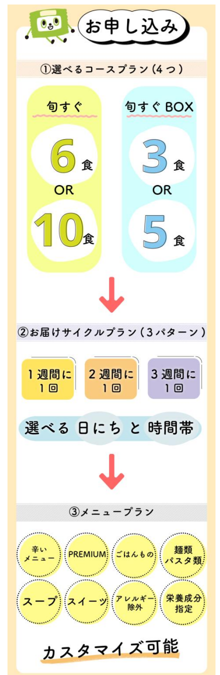
【お申し込みプラン】