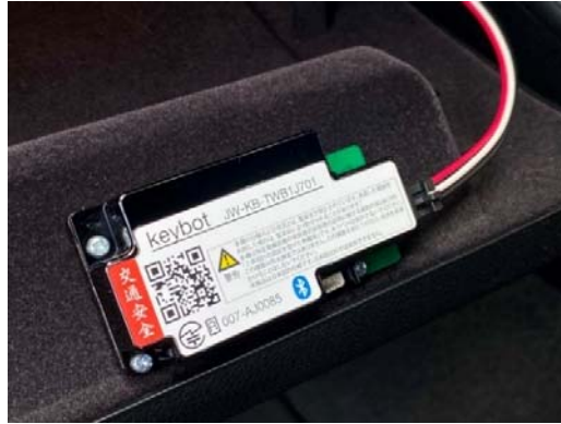
バーチャルキー車載器

「バーチャルキー」は、これまでの実績としてスマートバリュー「Patto」を使ったスズキディーラーの試乗車などのカーシェア化や、NTT 東日本の社用車を休日にカーシェア化する株式会社 NTT ル・パルク「ノッテッテ」、マンション住民に向けた EV カーシェアを提供する九州電力株式会社「weev」、福井県が取り組む「嶺南スマートエネルギーエリアプロジェクト」のカーシェアにも使われています。他にも「バーチャルキー」は、レンタカー事業者の DX による業務効率の改善や経費削減に寄与し、ニューノーマル時代の事業成長に貢献いたします。24 時間非対面貸出しを実現したバリュートップ株式会社「オールタイムレンタカー」や、J-ウィングレンタリース株式会社が運営する非接触非対面の「スカイレンタカー・スマートサービス」、J-net レンタリース株式会社が運営する「J ネットレンタカー」の実証実験などをスマートバリュー「Kuruma Base」とともに進めています。他にも、株式会社ガーデュが提供するレンタカー運用管理システム「RAC+」への提供、中古車販売におけるローンの可能性を広げる株式会社 IDOM「ガリバースマートローン」、Jリーグ湘南ベルマーレホームタウン住民の方を中心に提供する「ベルマーレカーシェア」、奈良先端科学技術大学院大学におけるブロックチェーンを活用したカーシェアリング実験システム「持続可能モビリティ社会システム運用実験」などにもご利用いただいております。