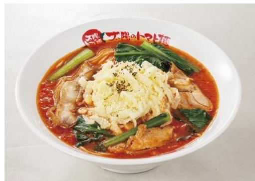
太陽のチーズラーメン