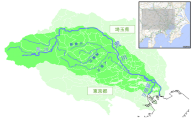
▲ちちぶ地域と関係の深い荒川流域の供給エリア

※RE100とは https://www.there100.org/ グローバル企業が気候変動対策として、事業で使用する電力の再生可能エネルギー100%化にコミットする協働イニシアチブです。世界で 300 社超、うち日本企業 62 社が加盟しています(2021年11月現在)。『ちちぶ RE100 電力』はこの RE100 の条件に適合した電力です。