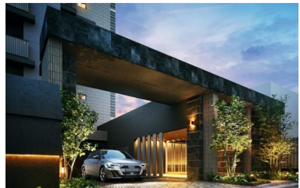
エントランス完成予想図