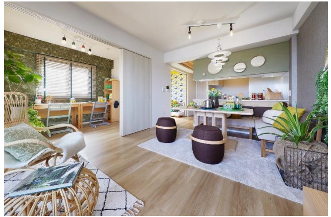
棟内モデルルーム(竣工済)