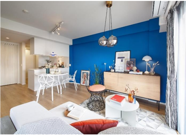
棟内モデルルーム(竣工済)