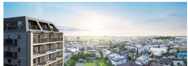
眺望合成完成予想図