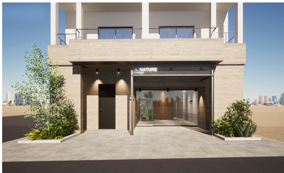
アルテシモ上十条（仮称）外観イメージ画像

特徴：断熱性能を高め、外壁や開口部から逃げる熱量を減らすことにより、単位面積当たりの一次エネルギー消費量を 20%程度 (393MJ/m 2 ・年) 削減