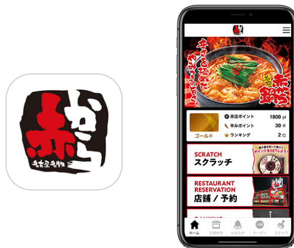
図1 『赤からアプリ』アイコンとトップ画面

その他にも、会員限定クーポンやイベント/新商品などの最新情報が届き、お店のカテゴリやGPS等による店舗検索が行えるなど、便利な機能を搭載しています。アプリから手軽にオンラインショップを利用することも可能です。