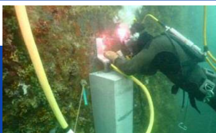
水中溶接作業の様子