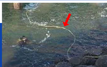
潜水土用の操作線ケーブル