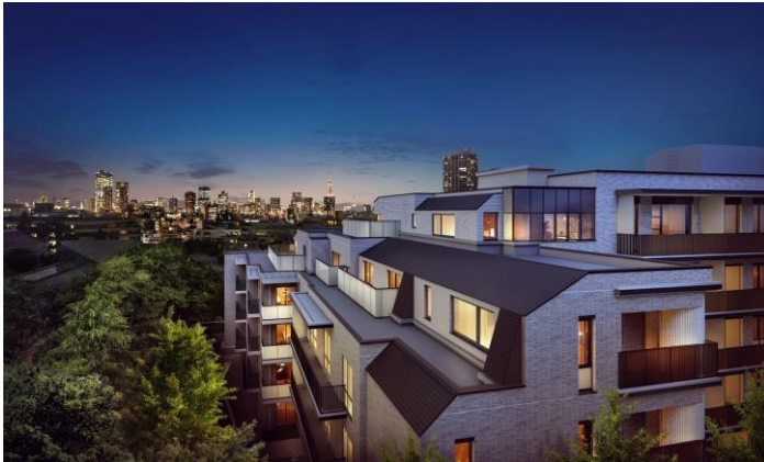
外観完成予想図（眺望合成）