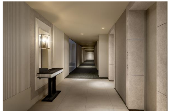
内廊下完成予想図