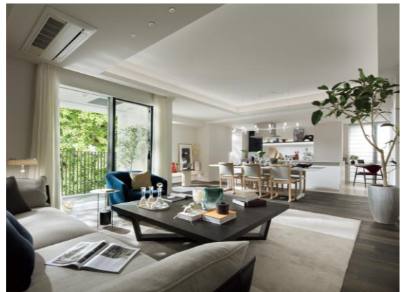
モデルルーム（リビング・ダイニング）