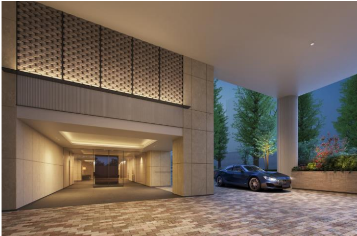
エントランスアプローチ完成予想図