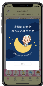
(表示されるメッセージのイメージ)

累計100万人以上のママ・パパの赤ちゃんのお世話をサポートしてきた「授乳ノート」は、夜間のお世話の記録後、ママ・パパユーザーに向けたメッセージコンテンツの配信を iOS 先行リリースいたしました。