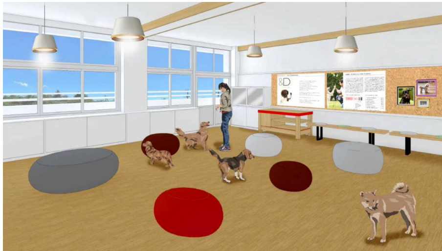
2F ドッグルームイメージ図