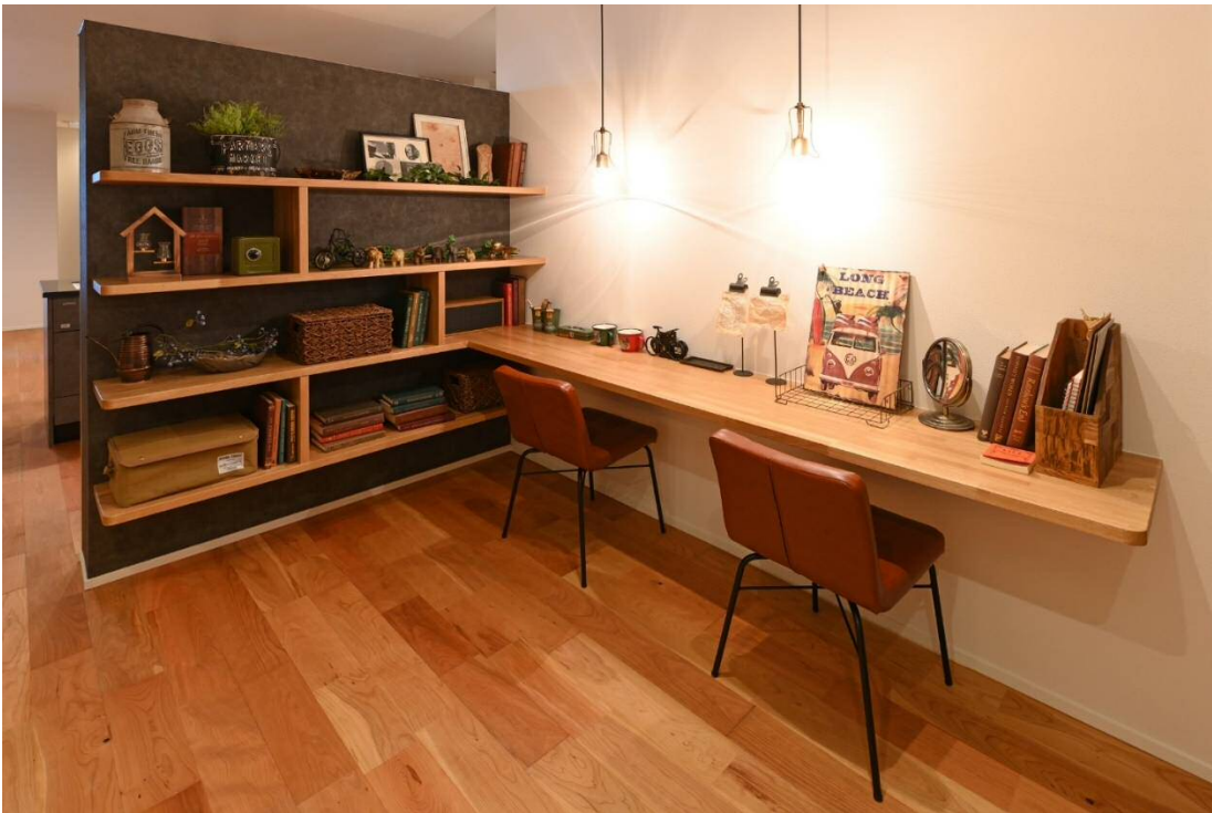
(写真は「sketch 福岡かすや店」 niko and... コラボのモデルハウス)