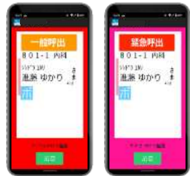
※ナースコール呼出イメージ