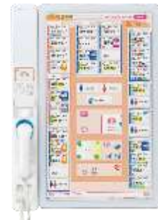
※ナースコール親機イメージ

医療・介護業界は、PHSの利用終了に伴う通信機器のリプレース需要や政府主導の『医師の働き方改革』、新型コロナウイルス感染症第6波への懸念などを背景に、IoT化が求められています。日本エンタープライズとケアコムは両社の強みを活かし、医療・介護業界における社会課題の解決に貢献してまいります。