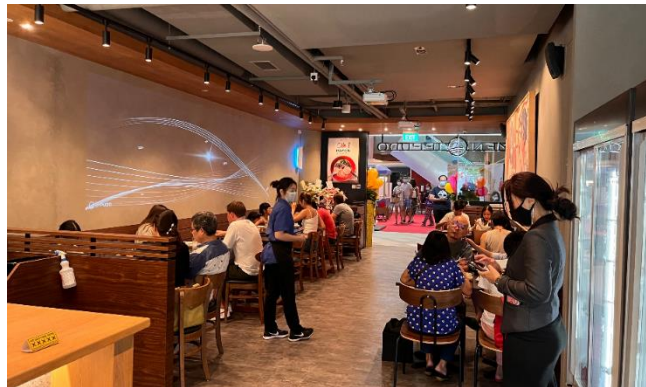
オープン当日の様子