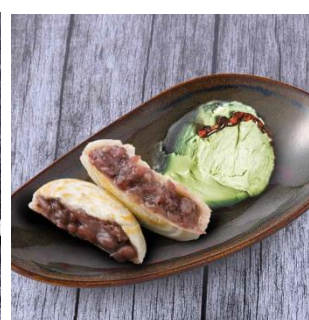
梅が枝餅と 抹茶アイスクリーム