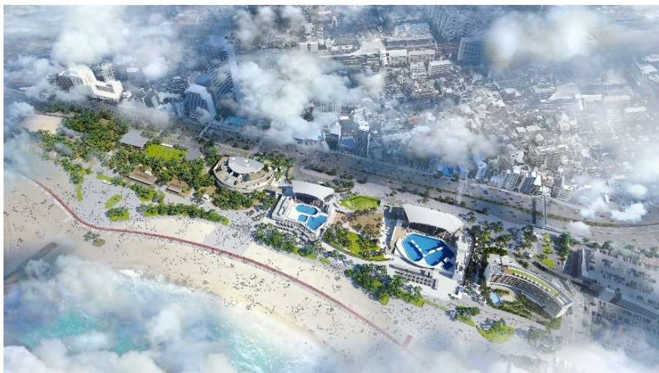
再整備後イメージ