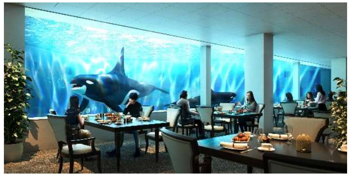
オルカレストランイメージ