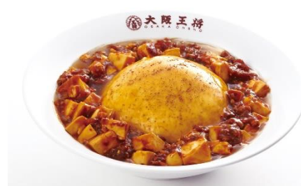
ふわとろ麻婆天津飯