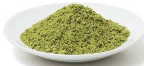
石垣島ユーグレナ粉末