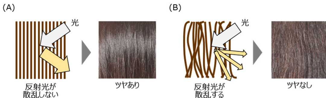
図1.毛髪の毛流れとツヤの関係.

ミルボンの調査では、多くの女性が加齢に伴う毛髪のツヤの低下を感じていることがわかっています。加齢に伴うツヤの低下の要因を解明することは、効果的なツヤの改善方法を見出すのに重要です。ツヤは、毛流れが揃い毛髪表面で光が反射することで感じられます(図1-A)。しかし毛髪の毛流れが揃わなくなると、反射光が散乱してツヤが低下します(図1-B)。