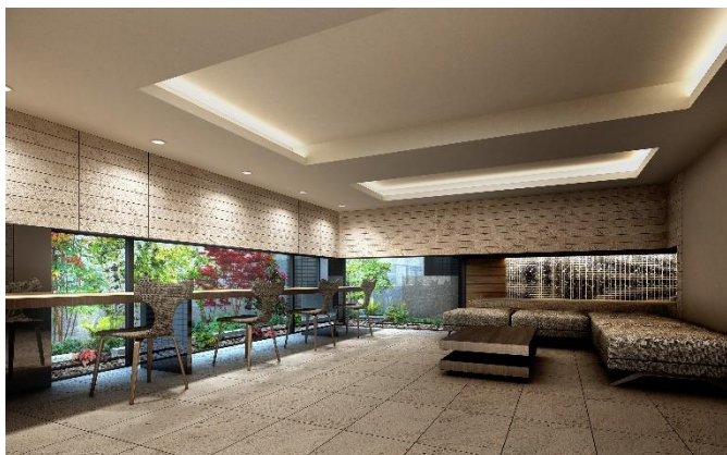
エントランスホール完成予想図 (※3)