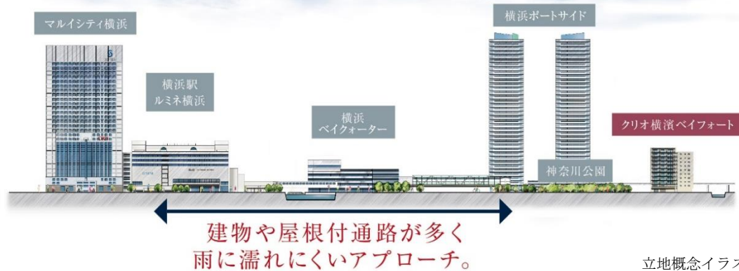
立地概念イラスト（※2）

「横浜」駅を徒歩圏とした快適な都市生活を楽しみながら、日々の暮らしに海と緑の潤いも享受できる横浜ベイエリアでのライフスタイルをご提案しています。