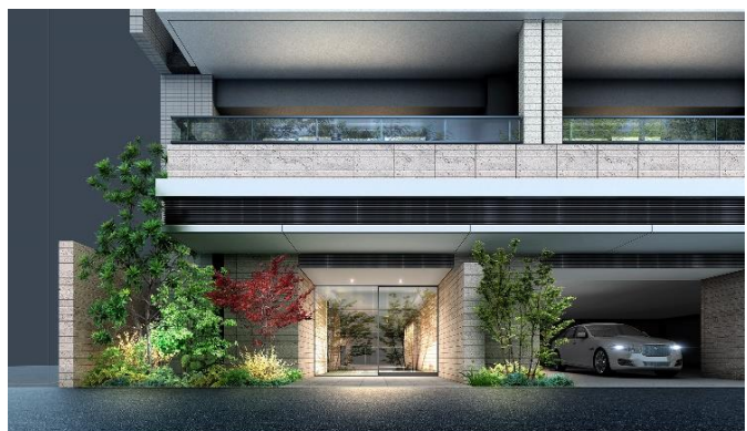
エントランスアプローチ完成予想図（※3）