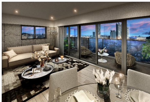
リビング・ダイニング完成予想図 (Eタイプ) (※14)