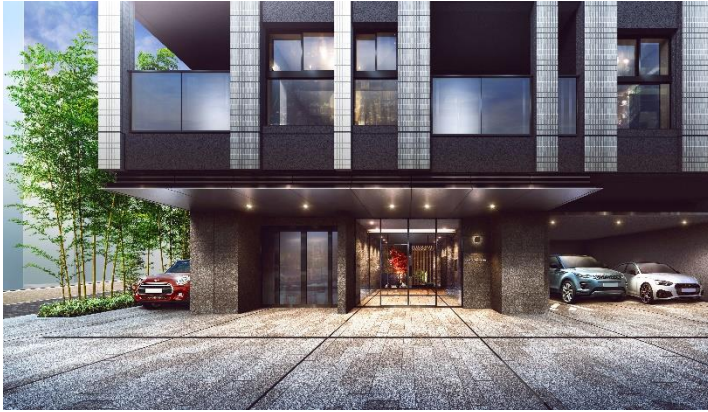
エントランス完成予想図（※2）