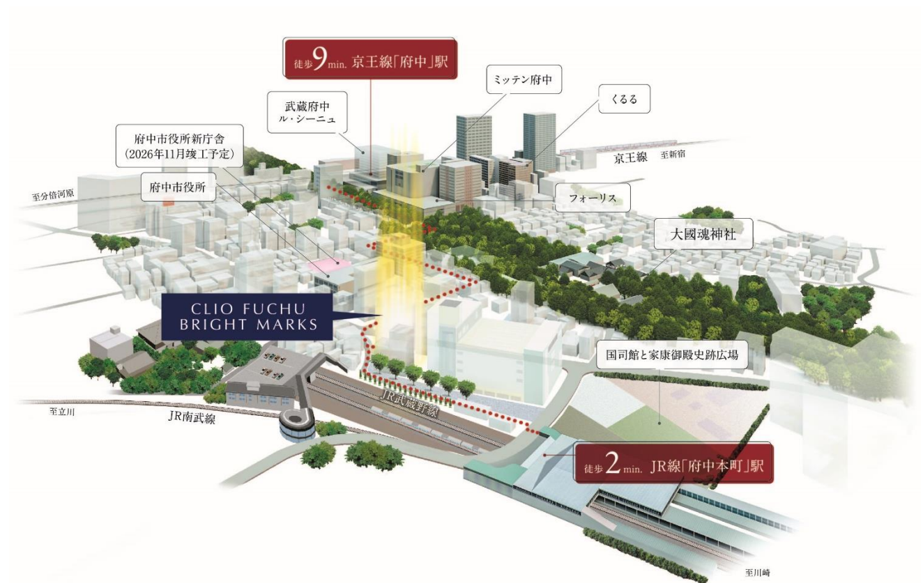
立地概念イラスト（※1）

「クリオ府中ブライトマークス」は、JR南武線・武蔵野線「府中本町」駅徒歩2分、京王線「府中」駅徒歩9分の場所に誕生します。京王線「府中」駅南口はペDESTリアンデッキにより複数の大型商業施設とつながっており、市役所をはじめ公共・文化施設が徒歩10分圏内に点在する便利で暮らしやすい都市生活環境が整っています。本物件は、「府中」駅を中心に約600メートル続く馬場大門の「けやき並木通り」を抜け、1900年を超える歴史ある大國魂神社（約170m）の厳かな緑を身近に感じられる立地に計画しています。1フロア4戸、全戸南西向きでワイドスパン住戸を多く設け、「広く暮らすための工夫」や「機能性」が備えられている44.07㎡～65.36㎡、1LDK～3LDKのプランをご提案しています。