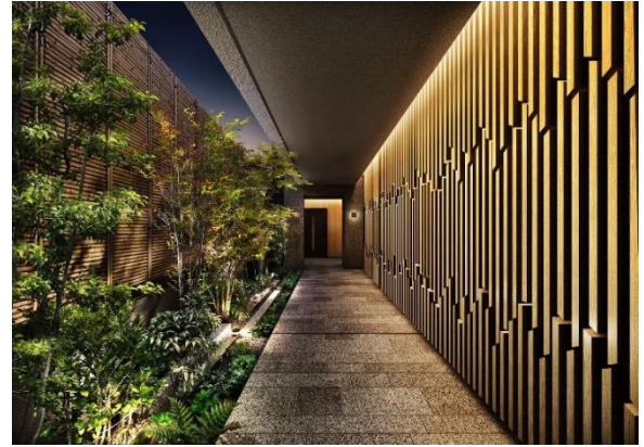
外廊下完成予想図（※2）