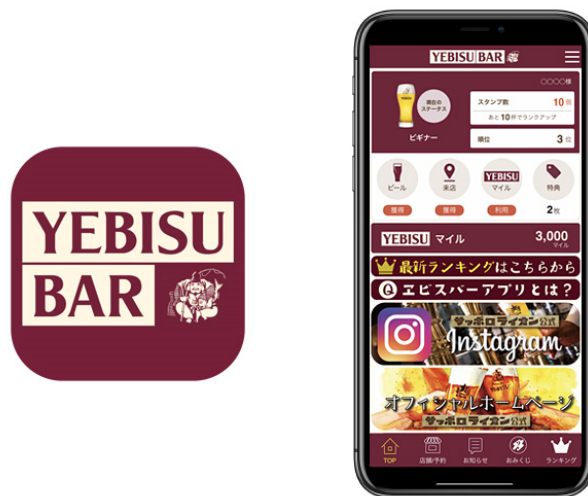
図1 『YEBISU BAR アプリ』アイコンとトップ画面

ビールの注文毎にもらえる“ビールスタンプ”は、スタンプ数に伴って会員ステータスが上がり、ステータスに応じてお得な情報が届きます。また、スタンプ数のランキング(総合/店舗別/月間)が表示され、楽しみながらお店に通っていただけるコンテンツとなっています。過去に飲んだビールの種類と杯数/日時/店舗は利用履歴で確認が可能です。その他にも、ステータスアップ/特典付与のお知らせやイベント情報などが届くプッシュ通知機能、店舗検索から店舗情報の確認や予約が行えるなど便利な機能を搭載しています。