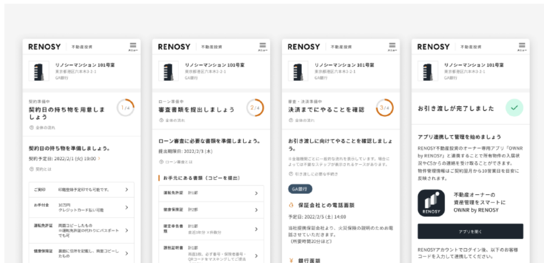
契約詳細ページの画面イメージ (Mobile)