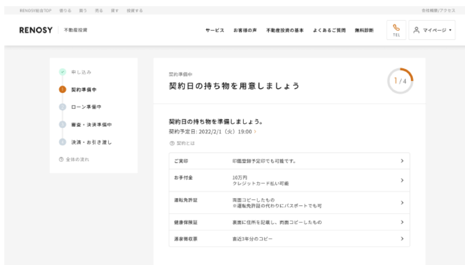
契約詳細ページの画面イメージ (PC)