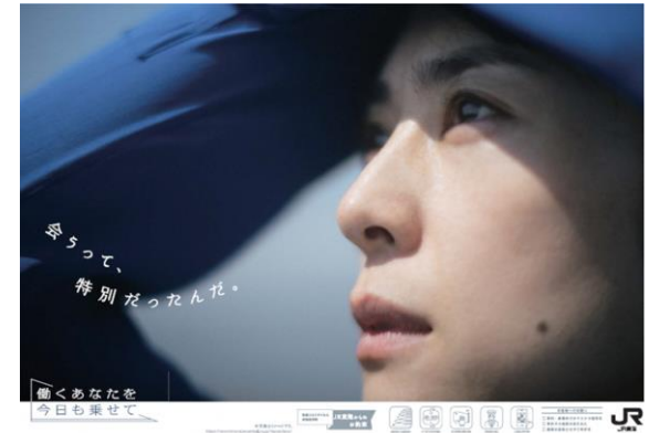
「会うって、特別だったんだ。」ポスター