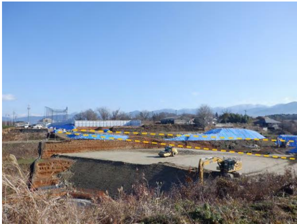
中部総合車両基地