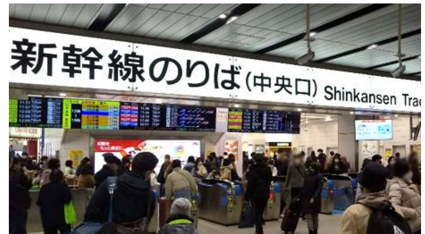
1/3 新大阪駅改札付近の様子