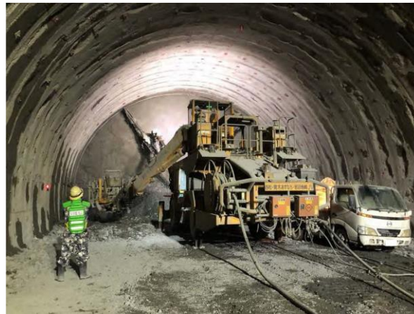
第四南巨摩トンネル (西工区)