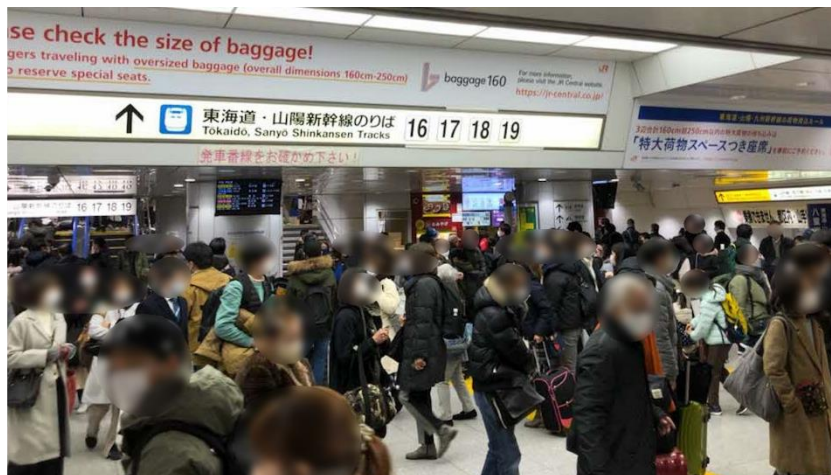
12/29 東京駅改札内の様子