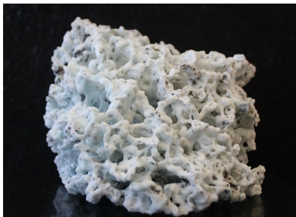
【NEO Silica メソポーラス構造標本】