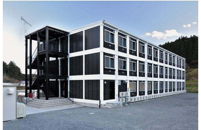
▲アイルーム南三陸

アズ企画設計は、東日本大震災で被災した地域の復興のため、復興事業を行う作業員の宿泊施設が広範囲にわたって不足している中、宿泊施設の建設が復興作業を加速させると判断し、2015年12月、宮城県本吉郡南三陸町に復興事業を行う作業員向けの宿泊施設「アイルーム南三陸」を建設し、ホテル事業を展開してきました。本宿泊施設は、在来工法と比べて大幅に工期を短縮することが可能なモジュール工法を採用し短い工期で建設した一方で、ゆがみにも強い重量鉄骨を採用しており、耐震性・耐久性・遮音性・断熱性に優れ、東日本大震災の復興事業を行う作業員向けの宿泊施設として多くの作業員の方々に宿泊していただき、復興の一助を担うための宿泊施設として、十分な役割を果たし、2021年8月末に営業を終了しました。