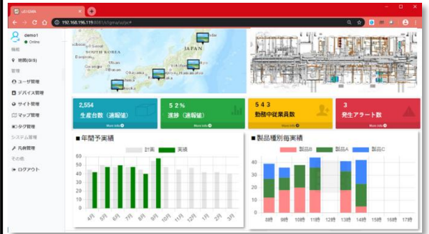
DXソリューション・パッケージ画面例 (人/モノ/AGV等の動態管理)