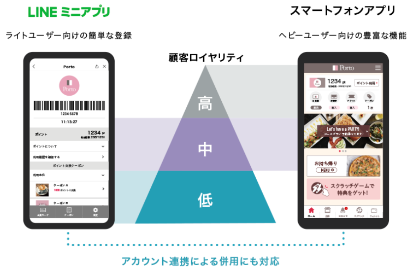
図1 『betrend』のLINE ミニアプリとスマートフォンアプリの使い分け

登録の簡便さでこれらの課題を解決できる『LINE ミニアプリ』をスマートフォンアプリと併用する“二刀流の顧客管理”をビートレンドでは推奨しており、『LINE ミニアプリ』の導入ハードルを下げるキャンペーンを実施します。