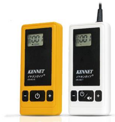
▲イヤホンガイド KR-400 (左) 受信機 (右) 送信機

イヤホンガイドは、観光地を中心に年間約70万人にご利用いただいている送信機と受信機からなる無線ガイドレシーバーです。1997年の発売以来、観光地をはじめ、工場・施設見学、美術館・博物館、セミナー会場、国際会議での同時通訳、スポーツ会場での解説など幅広いシーンで利用されています。旅行関連市場では90%以上の国内シェアを有しており、新型コロナウイルス感染防止に有効な「3密回避」ツールとしても各業界から好評いただいております。