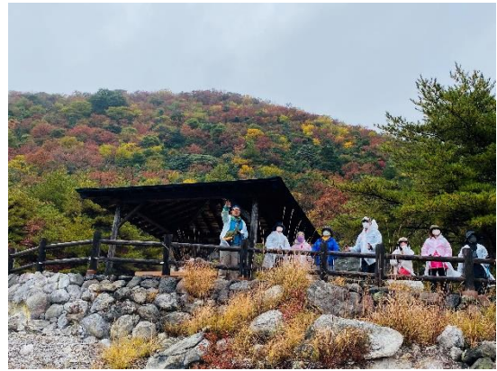
▲ポールウォーキングの様子

「島原半島」は、長崎県南部に位置し、泉質の異なる3つの大きな温泉があることや、半島南北にも温泉が湧くことから「雲仙温泉郷(うんぜんおんせんきょう)」と古くから呼ばれ、親しまれています。他にも、世界文化遺産の「長崎と天草地方の潜伏キリシタン関連遺産・原城跡」や「島原半島ユネスコ世界ジオパーク」などもあり、長崎県を代表する人気観光地となっています。