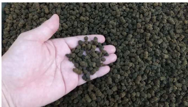
多気ブランド飼料

養殖方法：陸上養殖 閉鎖循環式（多気町）、地下水かけ流し式（石井養殖(岐阜県大垣市)）