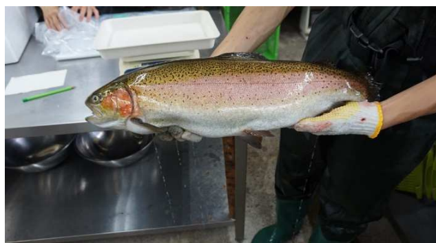
多気サステナブルサーモン