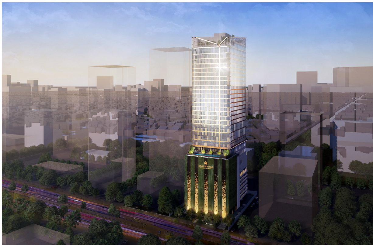
『グランドニッコー・バンコク サトーン』外観イメージ

西松建設株式会社(本社:東京都港区、代表取締役社長:高瀬 伸利、以下「西松建設」)、芙蓉総合リース株式会社(本社:東京都千代田区、代表取締役社長:辻田 泰徳、以下「芙蓉リース」)および株式会社ホテルオークラの子会社でホテル運営会社である株式会社オークラ ニッコー ホテルマネジメント(本社:東京都港区、代表取締役社長:荻田 敏宏、以下「オークラ ニッコー ホテルマネジメント」)は、タイ王国(以下「タイ」)の首都バンコクにおいて『グランドニッコー・バンコク サトーン』を 2025 年に開業する予定です。