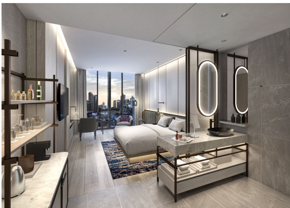
『グランドニッコー・バンコク サトーン』標準客室イメージ

さらに、エグゼクティブラウンジ、フィットネス、スパ、宴会場を有し、レジャーとビジネスの両側面からお客様の滞在をサポートします。